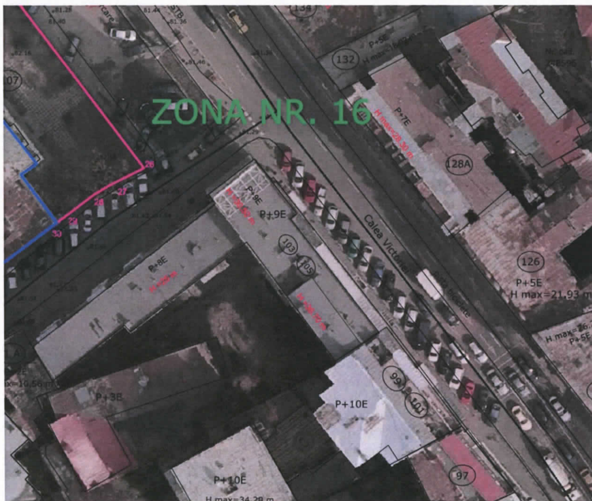
Sursa: ridicare topografica ortofoto

Volumetria propusa respecta cerintele si incadrarea in volumetria contextului vecin intrucat spre Calea Victoriei, actualele cladiri din frontul principal au inaltime variabile intre 28,00 m si 36,90m, conform imaginii de mai jos, cu Regim de inaltime cuprins intre P+7Etaje si P+9Etaje+Etaj tehnic. Ecranul avizat de Ministerul Culturii se aliniaza la aceste inaltime, a.i. inaltimea maxima propusa de 34,45m se inaceadreaa in peisaj.