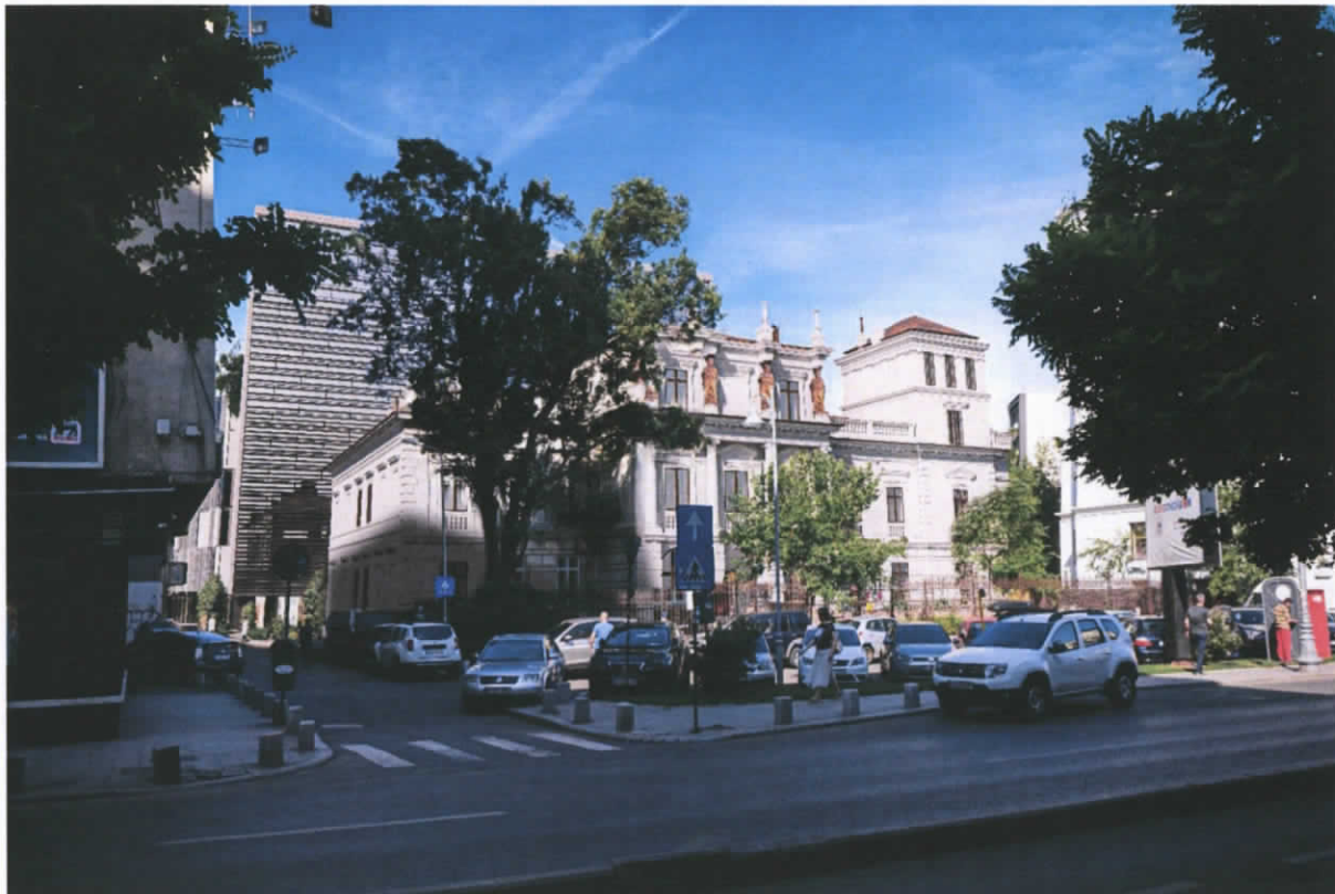
Sursa: H VICTORIA STIRBEI GALLERIES S.R.L. - Relatie palat - cladire propusa

Imagine frontala asupra Palatului dinspre Calea Victoriei nu este alterata de volumul neutru propus, retras la aproximativ 17 m de palat, perceptia de la nivelul ochiului sustine acest punct de vedere.