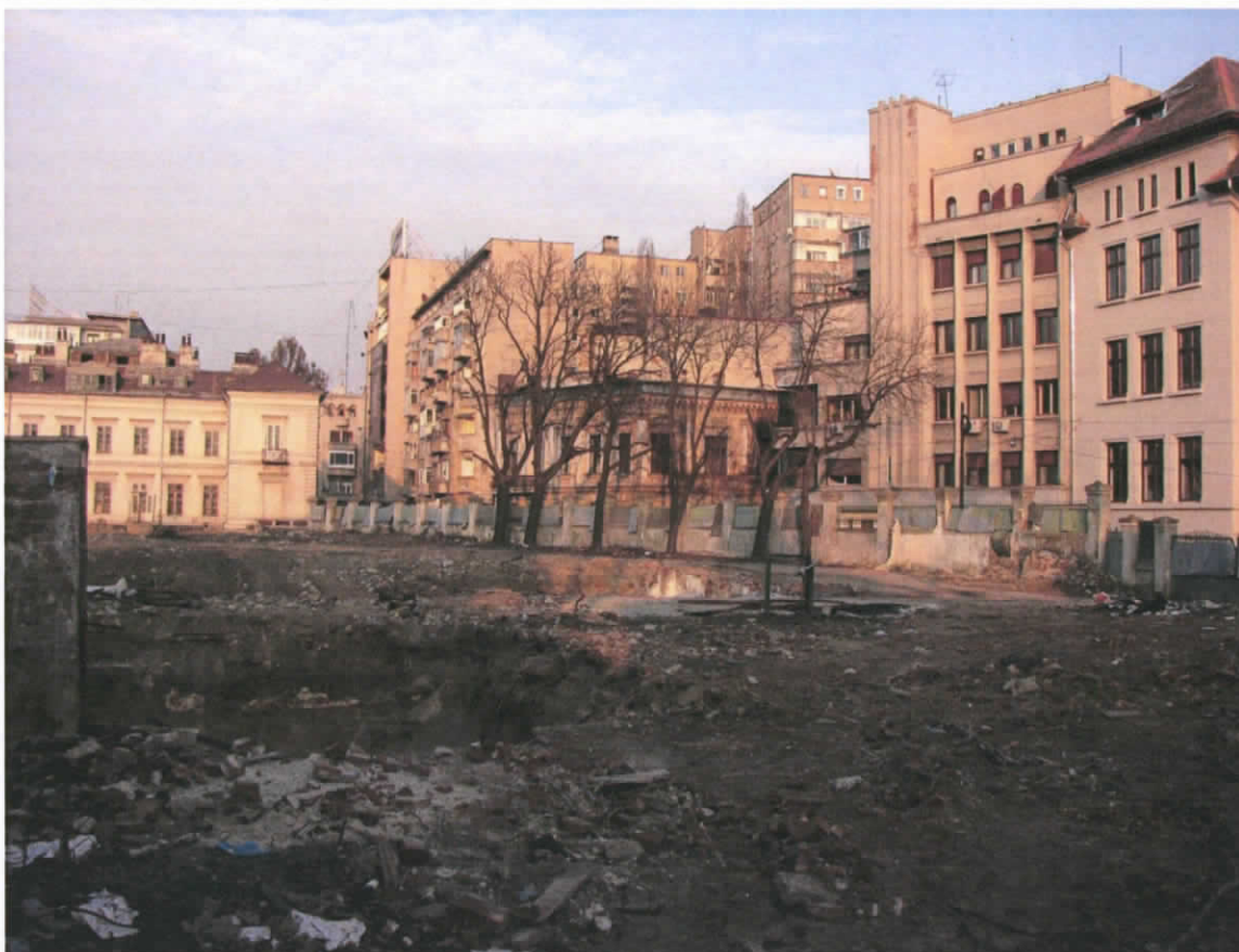
Vedere amplasament anul 2008

În prezent, conform planului atasat, pe teren sunt în marea majoritate arbori fără valoare dendrologică, otetar fals - cenuser cu diametru între 6 -20 cm dar și salcâmi și castani, într-un număr redus. Menționăm că arborii și arbuștii menționați mai sus nu sunt cuprinși în Lista arborilor și arbuștilor ocrotiți de pe raza Municipiului București .